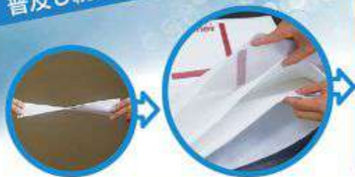
熱成型超吸収性シートを親水性特殊PP不織布に袋詰め