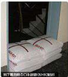
新下高層ビル工事現場