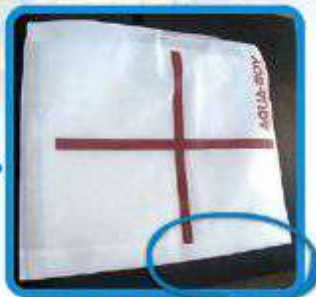
シートが漏水を捕まえ下に逃がしません!!