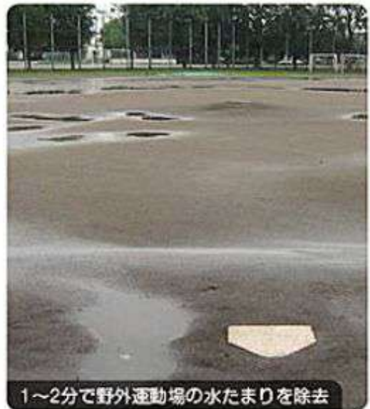
1～2分で野外運動場の水たまりを除去