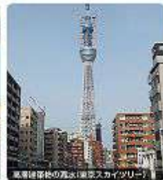
東京都管轄の高層(東京スカイツリー)