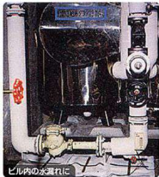
ビル内の水漏れに